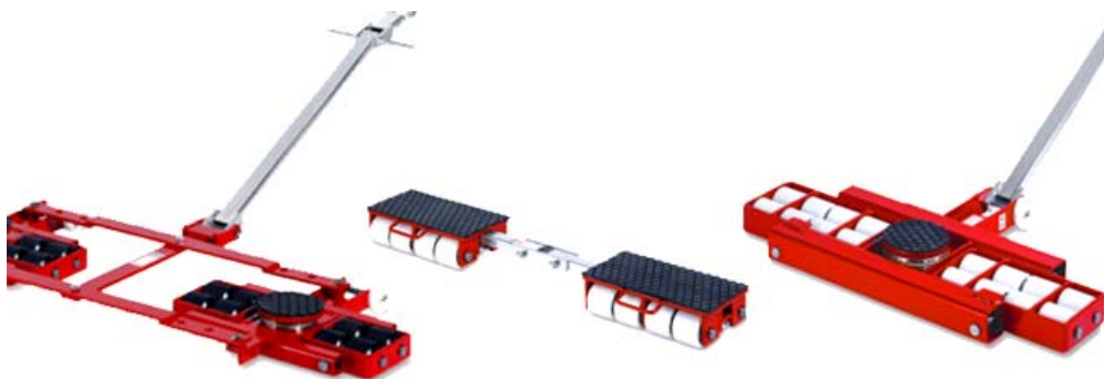
Рисунок 1 – Види такелажних візків з регульованим стержнем

Існує чотири типи такелажних візків за можливістю регулювання відстані між роликотими платформами: індивідуальні (використовують із шатуном, для регулювання діапазону ширини); тандемні (мають дві роликоті платформи, чотири точки контакту для покращеної стійкості та вантажопідйомності); керовані (з прикріпленою ручкою та поворотною вантажною платформою).