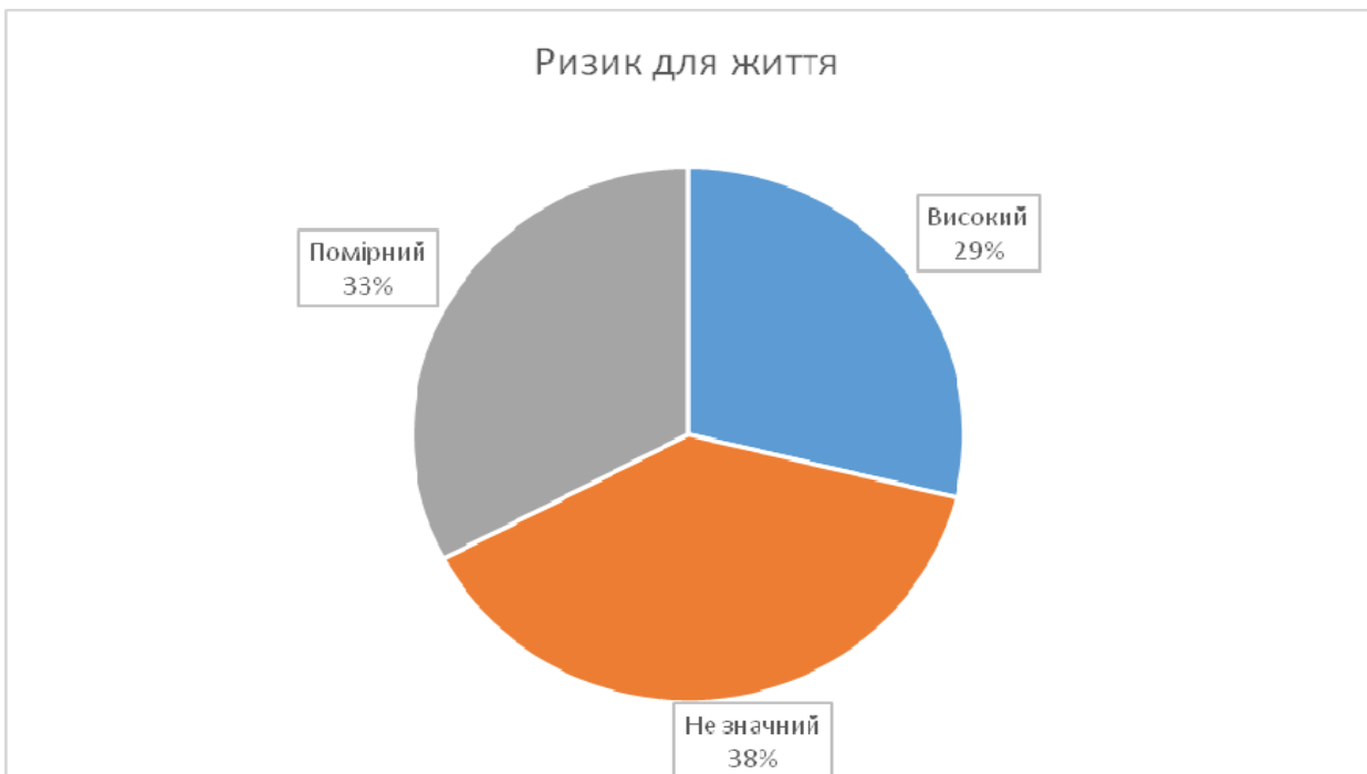
Рис. 2. Ступінь загрози для життя співробітника

негативний, режимні заходи не відбулись, зазначила 1 особа.