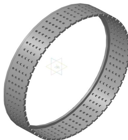
Рис. 2 – Рабочие колеса дезинтегратора 1 – рабочие диски; 2 – рабочие кольца