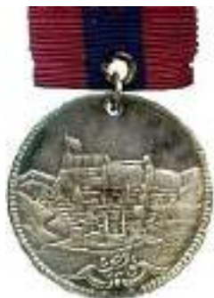
Рис. 2.1. Медаль «За оборону Карса» (срібло, Османська імперія, 1855)

правлений у фортецю Карс до підрозділу під командуванням Вільяма Фенвіка Вільямса 8 з отриманням капітанського звання турецької армії (27 березня 1855 р.). Навесні 1855 р. призначений начальником фортифікаційних укріплень Ерзерума. Після падіння Карса (листопад 1855 р.) був відряджений на спеціальну службу до Тробзона, де пробув до вересня 1856 р. За вірну службу під час російсько-турецької війни отримав дві турецьких медалі: «За оборону Карса» та «Кримську медаль» (рис. 2).