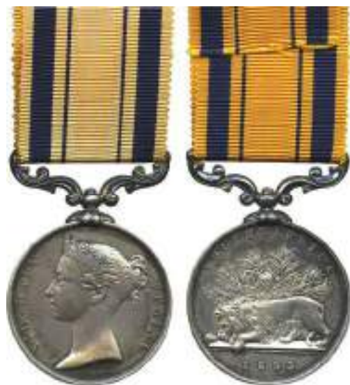
Рис. 1. Південноафриканська медаль британської армії (1854 р.) (срібло, Великобританія)

Спочатку Чарльз Кемерон обрав кар'єру військового і, придбавши офіцерський патент на звання прапорщика (молодшого лейтенанта) 5 , 19 травня 1846 р. він вступає на службу до 45-го Ноттінгемширського піхотного полку, який дислокувався на батьківщині матері (Кейптаун, Південна Африка), де прослужив до липня 1851 р. У 1854 р. його служба у резервістській частині полку була відзначена медаллю за участь у Сьомій Кафрській війні 1846-47 рр. 6 (рис. 1).