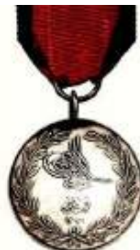
Рис. 2.2. Кримська медаль (срібло, Османська імперія, 1856)