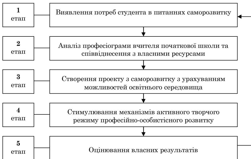
Рис. 2. Механізм залучення студентів до свідомого професійно-особистісного саморозвитку

Дієвим виявився також підхід (програмний), в основі якого лежить проектування та реалізація логічної схеми залучення студентів до свідомого професійно-особистісного розвитку в освітньому середовищі професійної підготовки. На рис. 2 представлено схематичне зображення етапів послідовності реалізації даного підходу.