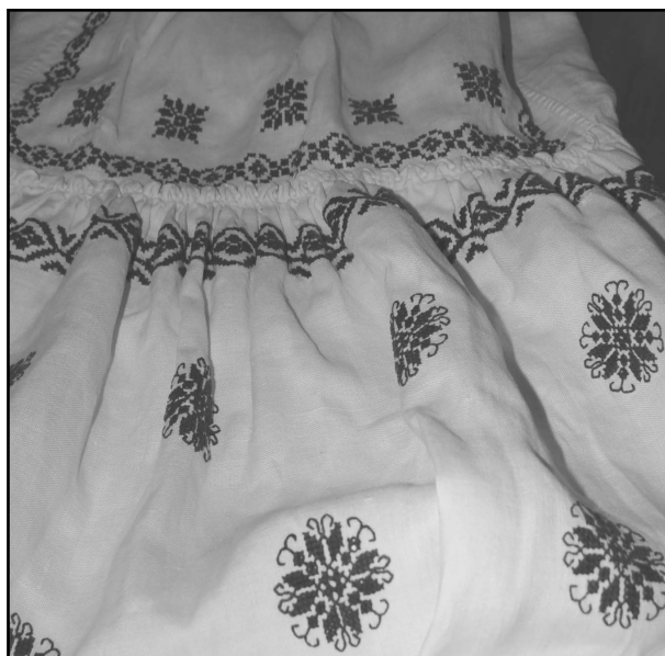
Фрагмент сорочки Олени Пчілки

Було вже поставив крапку, та через кілька днів знову повернувся до цієї теми і, мабуть, доречно. Спілкувався телефоном з В. К. Ясиновським, який щойно повернувся з усебразильського форуму українців, куди його запросила наша діаспора, й захоплено ділився враженнями, як тамтешні українці шанують пам'ять про Олену Пчілку. У місті Прудентополь (штат Парана) в Музеї Тисячоліття зберігається вишита сорочка, що належала нашій непримиренній українці. Від Валерія Кириловича я отримав дозвіл на публікацію його світлини фрагменту цієї сорочки в часописі «Рідний край». На таких гірких паралелях ставлю вже крапку.