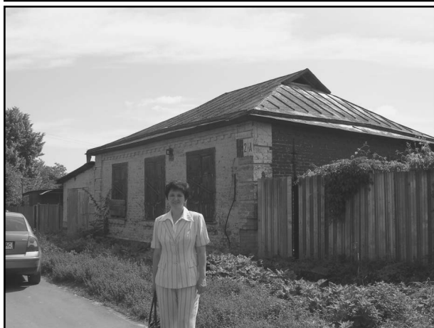
Остання світлина будинку по вул. П. Капельгородського, №12 "а"