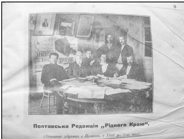
Полтавська Редакція „Рідного Краю“.

дитяча письменниця. Умисне замовчували її видавничу діяльність, якій жінка присвятила десять років свого життя.