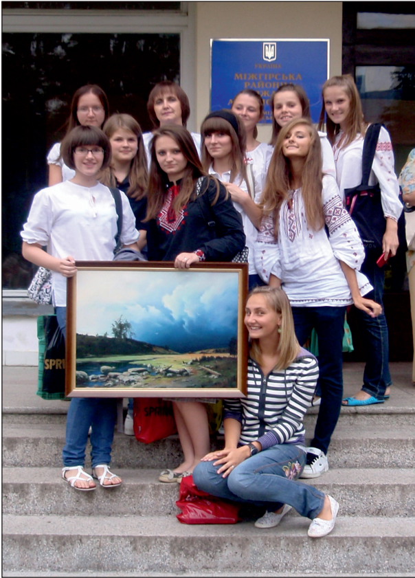
Із учасницями літературної студії “Перевесло”

ків. Це спонукає до подолання усталених стереотипів, застарілих цінностей і підходів, пошуку нового комплексу ідей, створення інтелектуальної основи школи ХХІ віку, школи самореалізації особистості, школи життєтворчості, полікультурного виховання на кращих досягненнях педагогіки світу”, – запевняє Тетяна Іванівна.