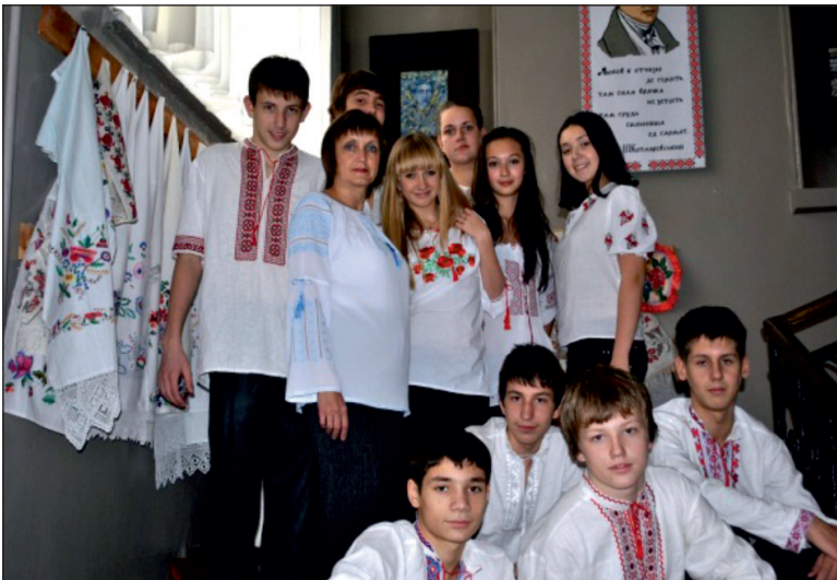
Із вихованцями – учнями Полтавського міського багатопрофільного ліцею №1 імені І. Котляревського