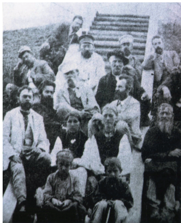
Українські інтелігенти на могилі Т. Г. Шевченка

У листі від 3.03.1893 року Андрієвський ділиться задумом видати книжечку «По Дніпру», у якій хоче належне місце відвести і Каневу. Він звертається до Гнилосирова з проханням допомогти придбати ілюстративний матеріал про Канів: «Хочу здійснити намір про задумане видання «По Дніпру»... Спочатку хочу видати «Від Києва до Катеринослава»... А хіба можна обійтися без Канева? А для цього мені потрібні ілюстрації... У мене є лише одна – «Могила Т. Шевченка», але цього мало... Допоможіть, дорогий земляче!..» (ІР НБУВ, Ф – III, № 4497).