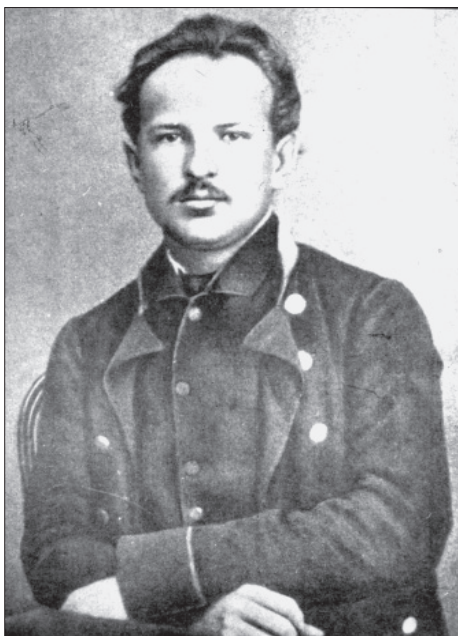
В. С. Гнилосиров (1836–1900), педагог, публіцист, просвітник

І той серйозно взявся за впорядкування цих матеріалів. До наших днів дійшли два рукописні зошити Гнилосирова під назвою «К истории могилы Т. Г. Шевченко» (ІР НБУВ, Ф – І, № 335), які висвітлюють шевченківські події 1882–1890 років.