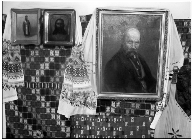
Інтер'єр Тарасової світлиці з іконою Спаса Нерукотворного

придбати. Після того, як ікона повернулася, ми мали змогу ближче її роздивитися, прочитати напис З. І. Краковецького. І, як виявилось, він там був не один. Нижче дарчого напису на зво-