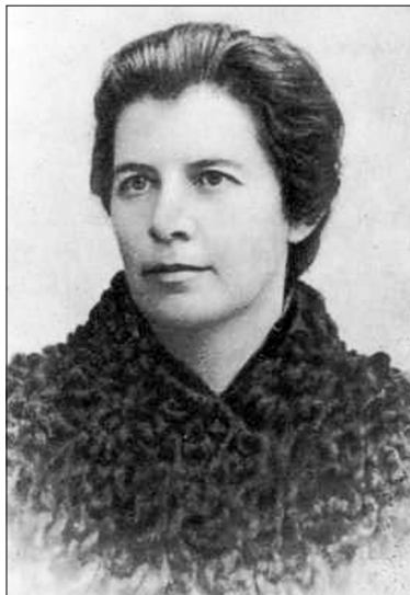
Олена Пчілка (13.07.1849–04.10.1930)