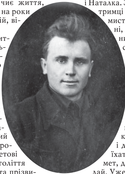
Харитон Бородай (1913–1944),

Народився Харитон Бородай 11 жовтня 1913 року в селі Байрак Диканського району Полтавської області в сім'ї з козацьким