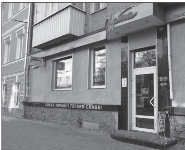
Галерея «Арта». 2014 р.

Зараз «Арти» понад десять років, її добре знають і люблять у Полтаві. А відкриття виста-