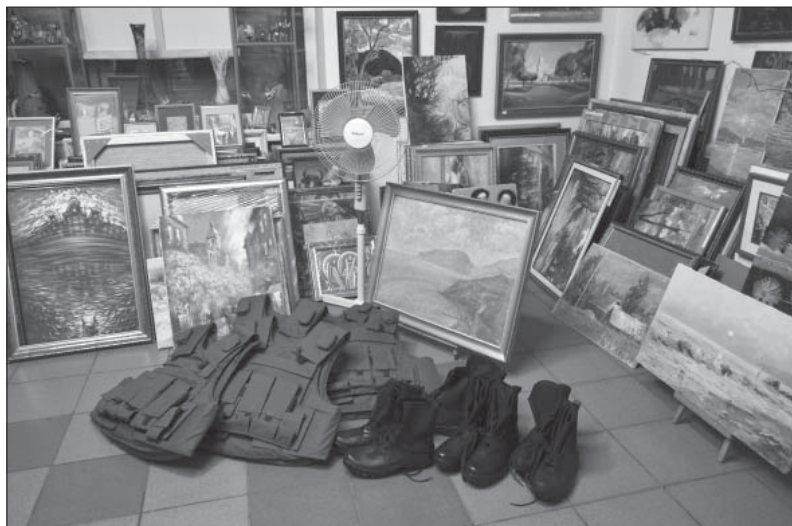
Допомога художників українським воїнам. Галерея «Арта». 2014 р.

виставку-продаж картин на підтримку української армії та національної гвардії. За «Українською весною» прийшли «Українське літо» і «Українська осінь», які стали реальною допо-