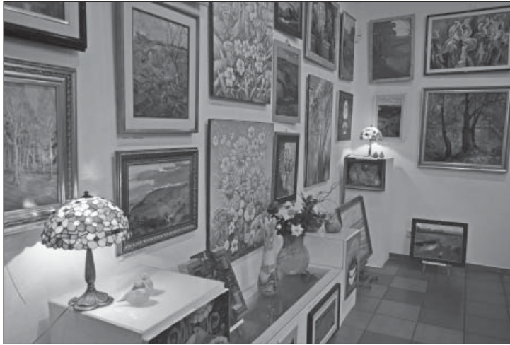
Благодійна виставка «Українська весна» на підтримку української армії. Галерея «Арта». 2014 р.

вок завжди є справжнім живописним святом. «Божевільна ідея» Петушинських утілилася в життя міста, перетворилася на острівець творчості, мистецьку паузу серед хаосу буденності. Галерея вистояла в складні роки, не зрадила мистецької ідеї, загартувала коло однодумців, створила власній стиль виставок і спілкувань.