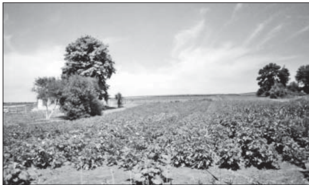
На цьому місці (на узвишші біля залишків липового гаю, що праворуч) стояла Денисівська початкова школа і мешкали вчителі