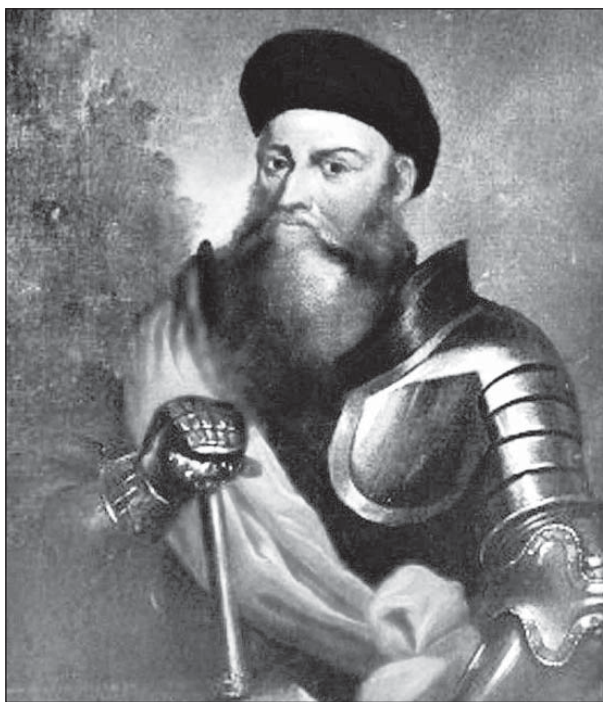
Князь Костянтин Острозький – найкращий воєначальник свого часу

Ярослав Дзісяк слушно зауважує, що ніколи до цього московське військо не зазнавало такої нищівної поразки. Майже через 150 років те саме говоримуть про битву під Конотопом. «Але якщо остання є добре вивченою і висвітленою в українській історіографії, то битва 1514 р. – маловідома. Проте якщо перемога під Конотопом все ж не врятувала України (Великого князівства Руського) і самого гетьмана Виговського, то перемога над московською армією Великого гетьмана Острозького під Оршею стала певною межею, яка означила кінець довгого просування Московії на захід – на подальше загарбання українських земель. Однією з причин була відсутність на початку XVI ст. потужних ворогуючих політичних груп в українському