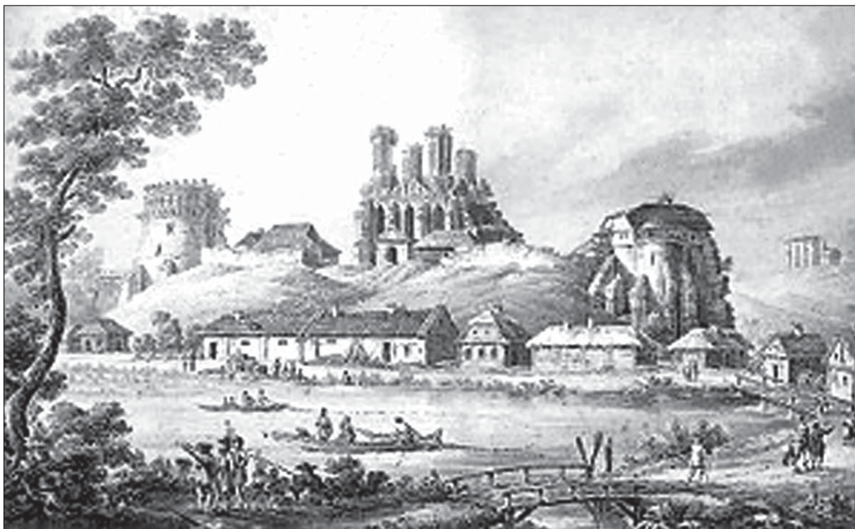
Зигмунт Фогель. Острозький замок

Тодішня геополітична ситуація до болю нагадує сьогоднішні торги Заходу з Путіним. Австрійський цісар Максиміліан I запропонував московському цареві Василю III забрати в Польщі частину українських земель. Цар за-