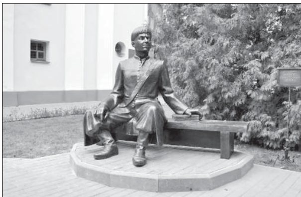
Пам'ятник Першому спудеві Східної Європи на подвір'ї Острозької академії

Ця ікона на початку XVIII ст. писалася як ікона святого Стефана і зберігалася в палаці князів Сангушків у місті Славуті. Чомусь вона не сподобалася князеві, тому полотно згори скрутили, а нижче заґрунтували й написали образ Ісуса Христа. І висіла ікона Спасителя в палаці