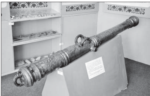
Якби-то всі гармати у світі були декоративними, як білогірська!..