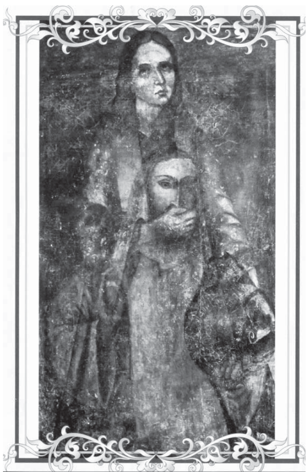
Ікона «Ісус Христос-Пантократор і Св. Стефан». Перша половина XVIII ст.

Побачили й ми таких усміхнених святих – Дмитрія Солунського і Езекіїла та Сафонія. А між їхніми ясними ликами – найбільше диво цього храму: ікону, на якій святий Стефан закриває рукою вуста Ісуса Христа.