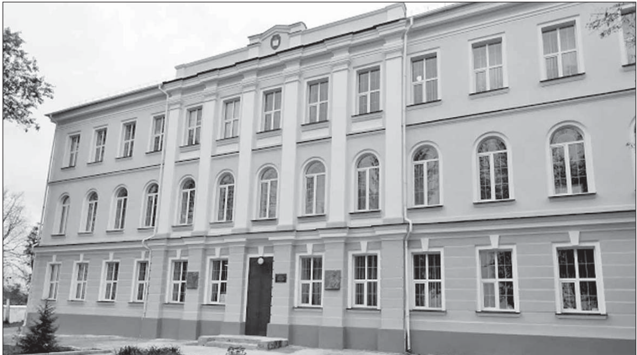
Гімназія в Острозі