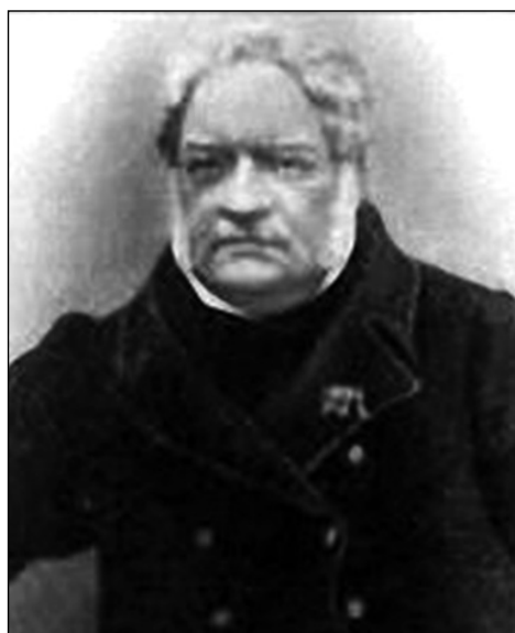
Василь Іванович Чарниш. Фото 1850-х рр. З особистого архіву академіка Ю. О. Митропольського

дуже афішував свою належність до аристократичного родоуду. На те були вагомі причини. Але він гостро переживав віддалення від малої батьківщини. Біль від утрати родового гнізда був настільки