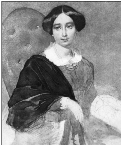
Тарас Шевченко. Портрет невідомої в блакитній сукні (акварель, 1845–1846)

Поміщику Василеві Чарнишу належали кілька