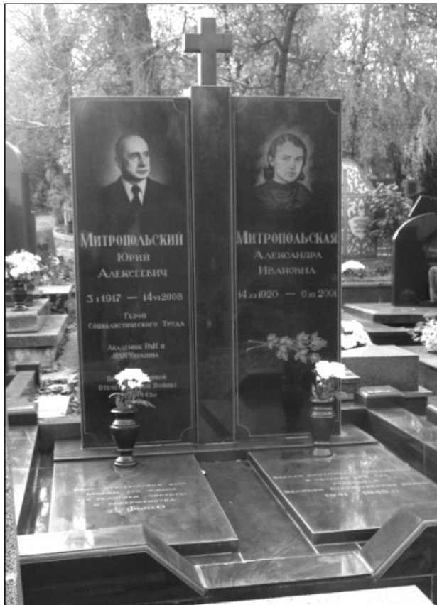
Могила Юрія Митропольського на Байковому кладовищі в місті Києві. Фото

Юрій Олексійович та Олександра Іванівна народили і виховали двох дітей. Їхній син Олексій (1942) нині знаний в Україні та за її межами вчений у галузі морської геології, геохімії та