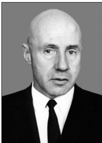
Учений-математик, академік, Герой України Юрій Олексійович Митропольський (1917–2008)

Ю. О. Митропольський разом зі своїми учнями і послідовниками розвинув оригінальні асимптотичні методи розв'язання систем диференціальних рівнянь із малим параметром, серед яких особливе місце посідає метод осереднення. Розв'язуючи задачі винайденим методом, він не тільки отримував результати своїх досліджень у вигляді математичних формул, а доводив їх до математичних моделей, необхідних проектувальникам і конструкторам. Тепер інженери можуть, не заглиблюючись у математичні тонкощі, передбачити наслідки коливних процесів у системах при нестаціонарних режимах, зокрема і при проходженні через резонанс.