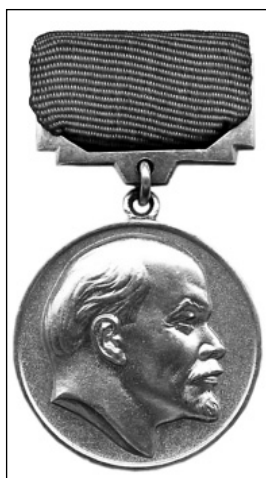
Почесний знак Ленінської премії (СРСР)

ливань систем із параметрами, що змінюються поволі. Із доповіддю «Метод інтегральних многовидів у теорії нелінійних коливань» він виступив на пленарному засіданні Міжнародного симпозіуму з теорії нелінійних диференціальних рівнянь і нелінійної механіки (Колорадо-Спрингс). До цього, у 1956–1960 роках, академік побував у Румунії, Польщі, Англії, Китаї, Італії, де читав лекції в університетах і виступав із доповідями на міжнародних конгресах із математики (Единбург, 1958), теоретичної механіки (Стреза, 1960).