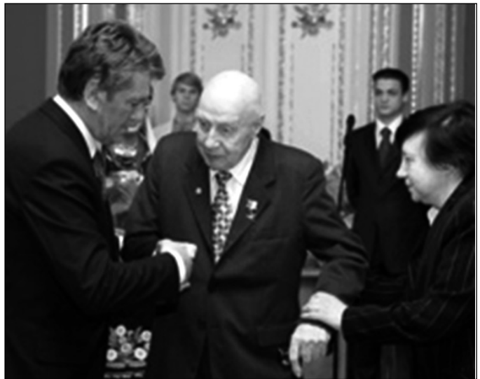
Президент України В. А. Ющенко нагороджує академіка Ю. О. Митропольського орденом «Золота Зірка».

Багато зусиль Ю. О. Митропольський віддав педагогічній діяльності, підготовці і вихованню молодих поколінь математиків. Одночасно з науковою й науково-організаторською роботою в Академії наук він чимало років працював у Київському державному університеті імені Т. Г. Шевченка доцентом (1949–1951), завідувачем кафедри (1951–1953), професором кафедри диференціальних рівнянь (1954–1989), читав лекції та керував аспірантами. Ним підготовлено 100 кандидатів і 25 докторів фізико-математичних наук. Особливо