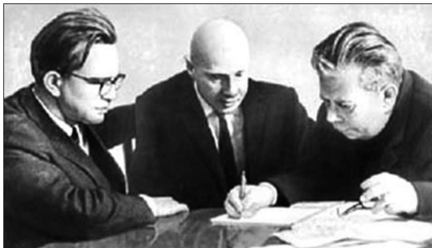
Корифеї математики України (зліва направо): академіки Віктор Михайлович Глушков, Юрій Олексійович Митропольський, Микола Миколайович Боголюбов. Фото. 1970-ті рр.

...Некомпетентній людині може здатися, що математика дуже далека від життя. Це не так. Просто математика в своєму абстрагуванні фактів йде далі за інші науки.