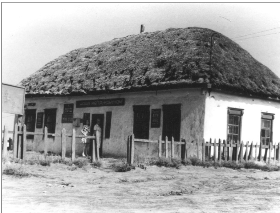
Куркульська хата. Збудована у 1920-х рр. Лозунг на хаті «Наша мета – комунізм». Зруйнована у 1980-х рр.

У селі швидко розвивалися гуртки художньої самодіяльності. У сільському клубі часто грав оркестр струнних народних інструментів під керівни-