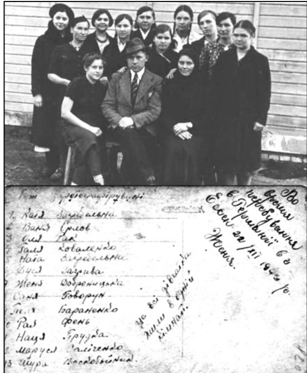
Група молоді із с. Солошиного – німецьких оstarбайтерів у роки Другої світової війни. Підписи автентичні