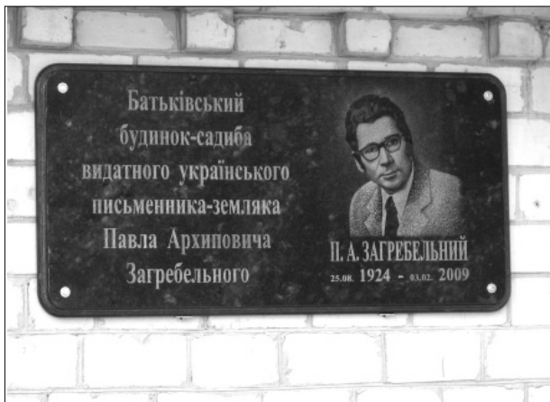
Меморіальна дошка на будинку Архипа Панасовича Загребельного в с. Солошиному. Відкрита 25.08.2012 р.