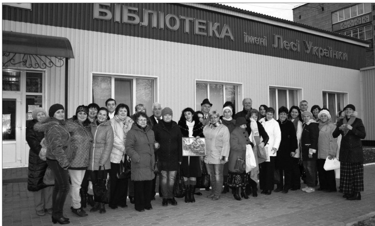
Відкриття літературного маршруту «Лесиними стежками». Фото, м. Гадяч, 22.10.2016 р.

Позитивним підсумком проекту є поява місцевих спонсорів і значної кількості волонтерів. Зверну увагу й на те, що на початку роботи майстерень не завжди вдавалося досягнути спільного бачення літературного маршруту. Наприклад, одна з майстерень не могла домовитися про те, який вигляд повинні мати інфраструктурні об'єкти на марш-