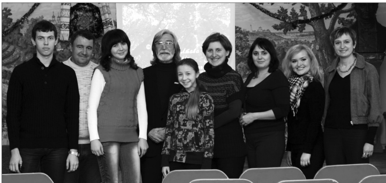
Учасники творчого семінару в літературній студії «Полтавські джерела». Фото, 4 січня 2011 р.

один рік. Адже спілка письменників – це передовсім громадська організація, яка має статутні цілі й завдання. Ще за часів СРСР за спілкою письменників закріпився державний тип управління,