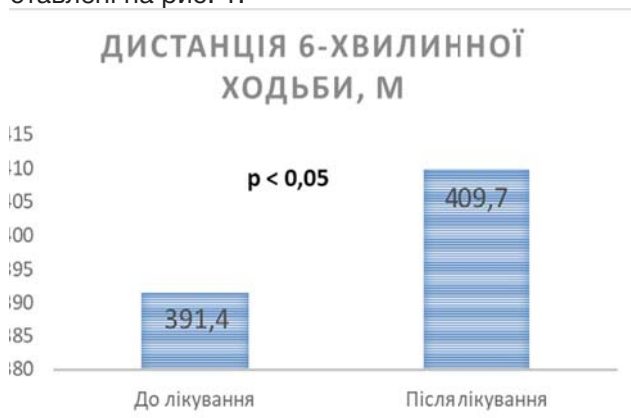
Рис. 1. Тест з 6-хвилинною ходьбою в досліджуваній групі до та після лікування.

Результати тесту з 6-хвилинною ходьбою представлені на рис. 1.