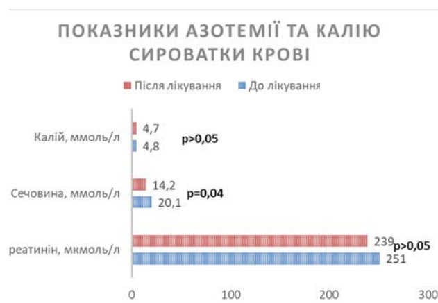
Рис. 3. Показники азотемії та калію сироватки крові до та після курсу лікування

При цьому відмічалось достовірне зниження сечовини сироватки крові після курсу лікування. Рівень креатиніну достовірно не змінювався, хоча відмічена тенденція до зниження – рис. 3.