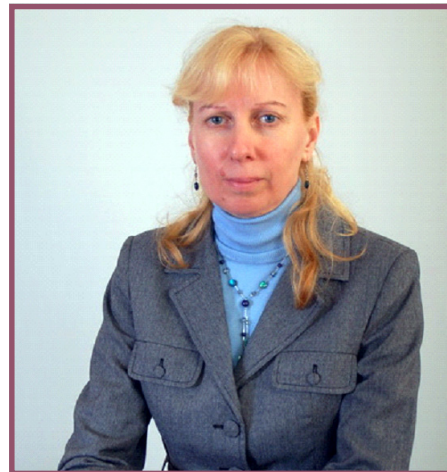
гетики (більше 100), у т.ч. ряд із них - у журналі «Біоенергетика/Bioenergy».