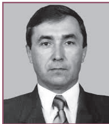
медаллю виставки «Агро-2011» за розробку й впровадження систем ефективного виробництва і використання біопалив в АПК.

Автор 338 опублікованих наукових праць, у тому числі однієї монографії, п'яти брошур та 78 авторських свідоцтв і патентів на винаходи, учасник багатьох вітчизняних та закордонних конференцій, семінарів і тренінгів з питань розвитку біоенергетики. У 2006 р. за роботу, виконану спільно з академіком НААНУ М.К.Лінником, відзначений премією НААН України «За видатні досягнення в аграрній науці». Разом з колегами авторів нагороджений золотою