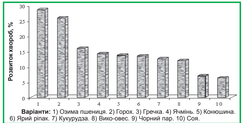
Рис. 1. Вплив передпопередників цукрових буряків на розвиток коренеюда, УЛДСС, 2011-2013 рр.