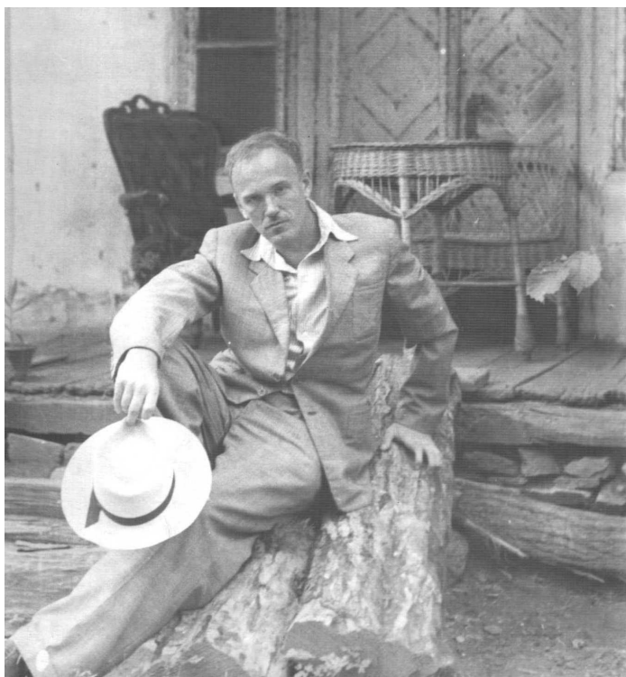
Фото 6. С. Т. Ріхтер біля будинку родини Семенових у Житомирі. 1950 рік.