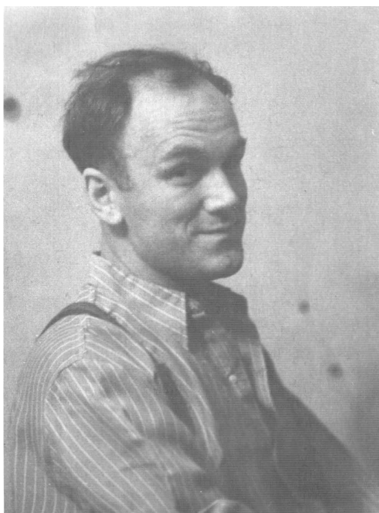
Фото 7. С. Т. Ріхтер. Кінець 1940-х – початок 1950-х років.