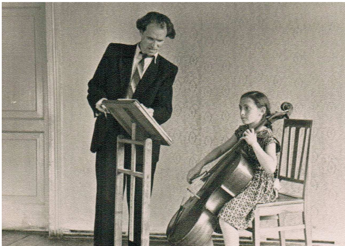
Фото 8. Урок у КССМШ ім. М. В. Лисенка. 1960-ті роки.