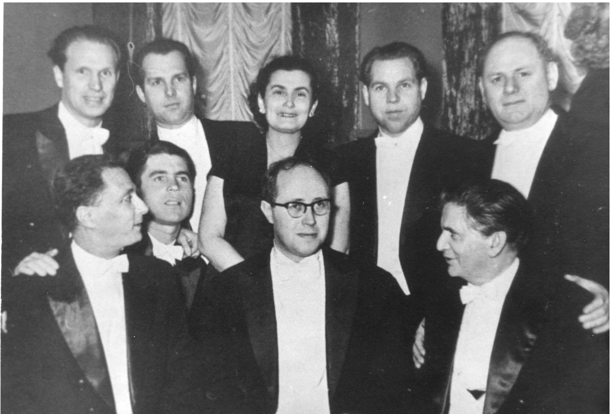
Фото 4. З маестро М. Л. Ростроповичем і професором Г. І. Пеккером. КДК ім. П. І. Чайковського. Після державного іспиту. 1955 рік.