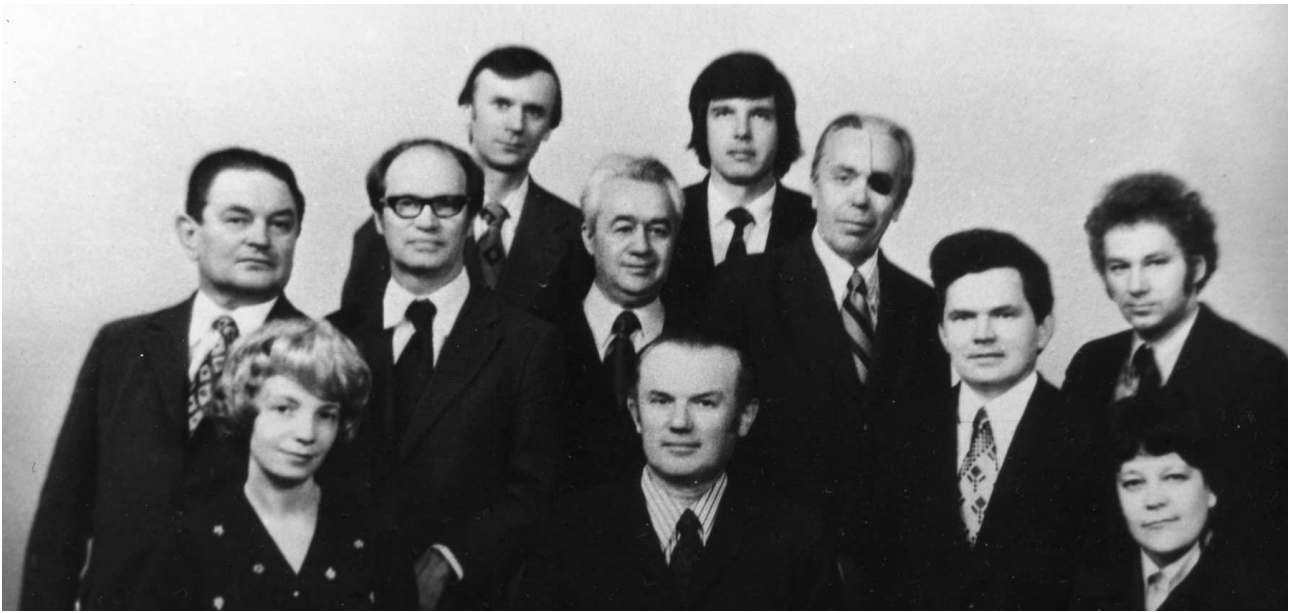
Фото 9. З колегами. Київ. 1971 рік.