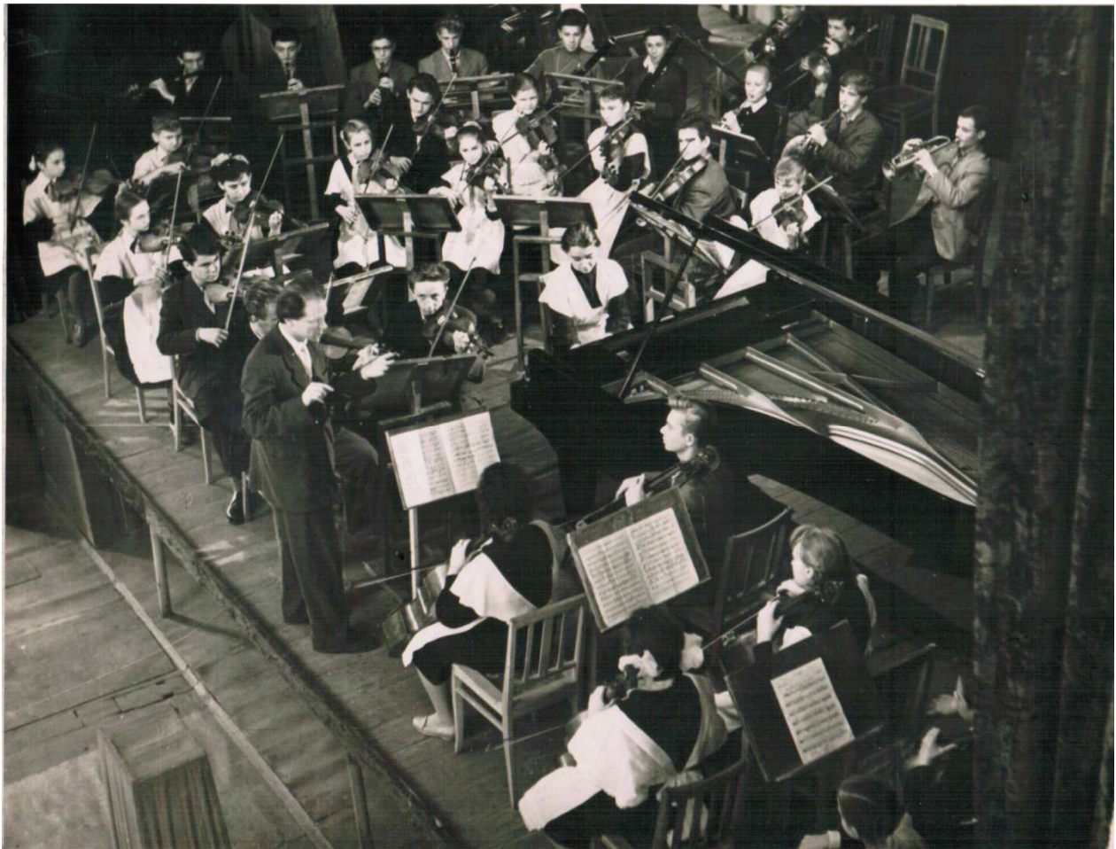
Фото 7. Ю. Полянський за диригентським пультом. Київ. Кінець 1950-х років.