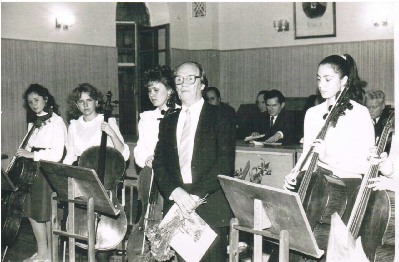
Фото 10. З учнями та колегами. Ювілей. 60-річчя. КДК ім. П. І. Чайковського. 1985 рік.