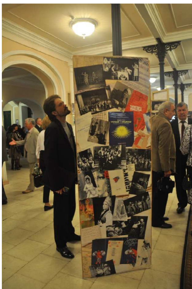
Фотовиставка, присвячена життю і творчості Володимира Лукашева.