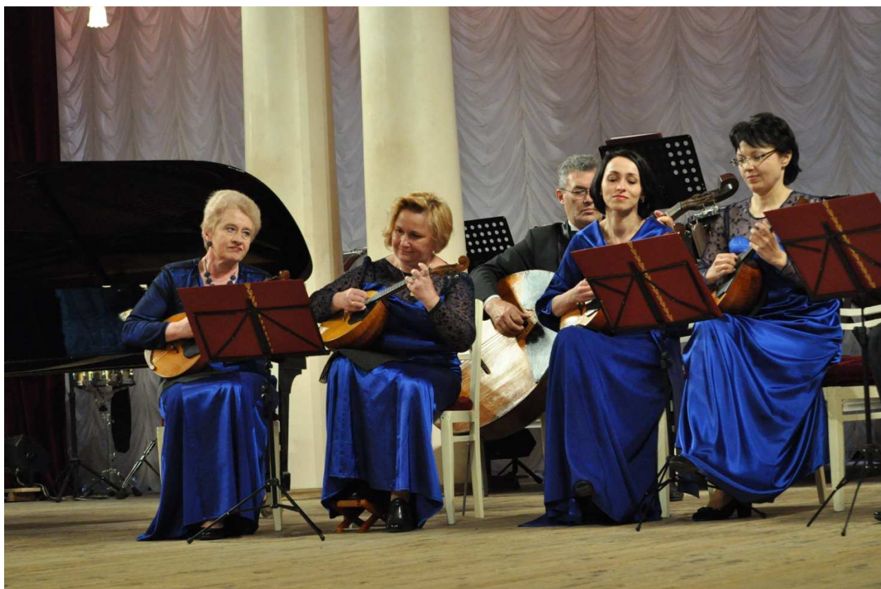
Привітання від Національної філармонії України. Ансамбль народних інструментів «Рідні наспіви».