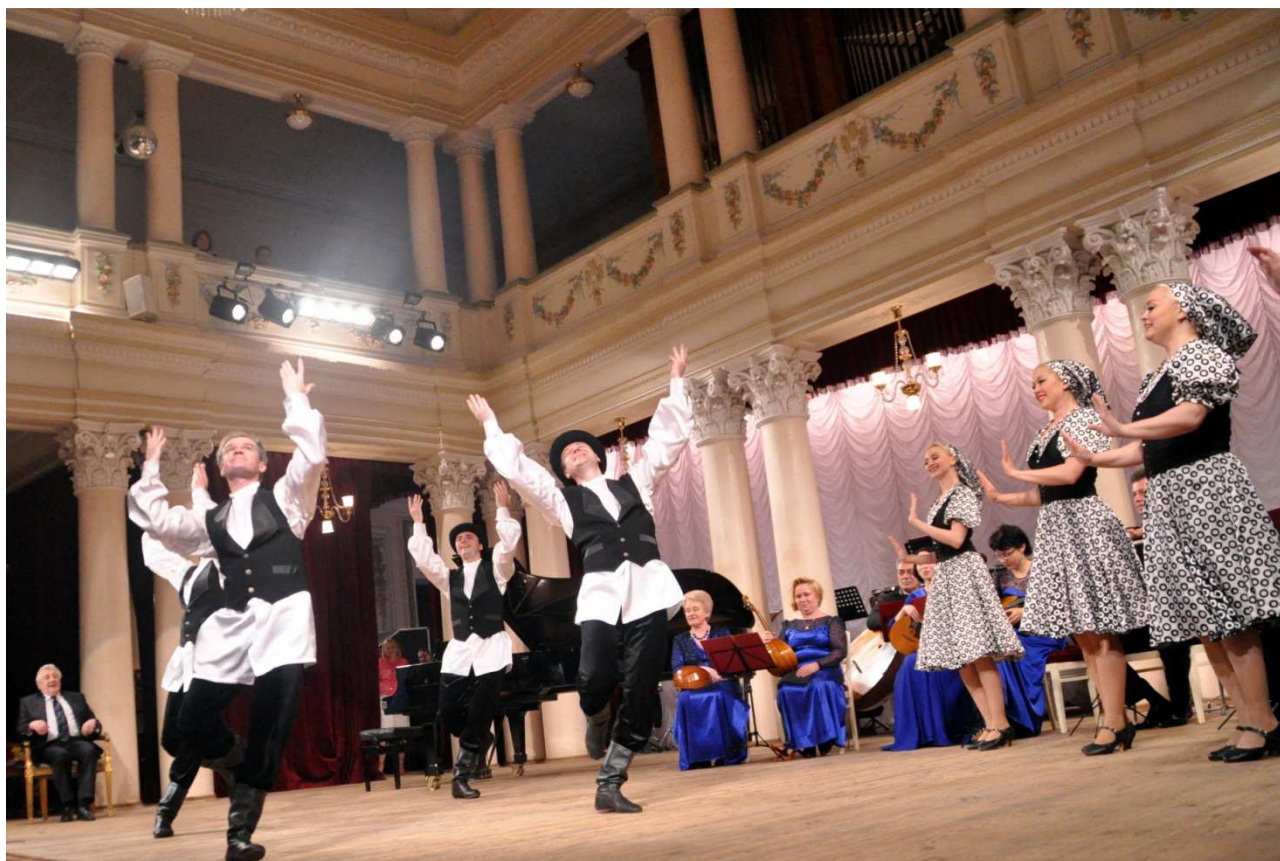
Привітання від Харківської філармонії. Танцювальний ансамбль «Герен».