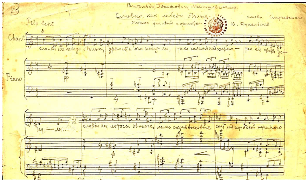
Фото 4. Володимир Дукельський. «Словно, как лебеди белые...». Слова К. К. Случевського (з присвятою Вітольдові Малішевському). 11 січня 1920 р. Одеса. Фрагмент рукопису. Архів Вернона Дюка (Vernon Duke). Бібліотека Конгресу США. Публікується вперше.