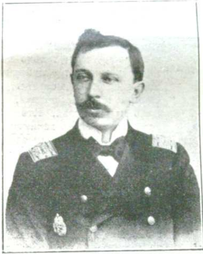
В. І. МАЛИШЕВСКИЙ, новый директоръ Императорскихъ музыкаль- ныхъ классовъ въ Одессѣ.