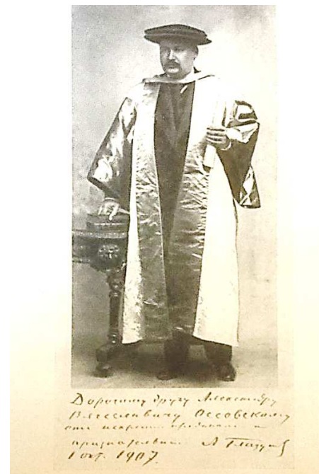
Фото 6. О. Глазунов, один з учителів В. Малішевського, почесний доктор Кембриджського університету. 1907 р. Дарчий надпис О. Оссовському 1 .