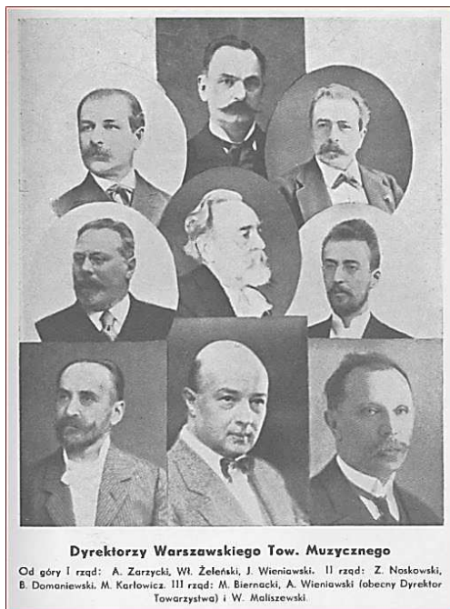
Фото 5. Директори Варшавського музичного товариства.