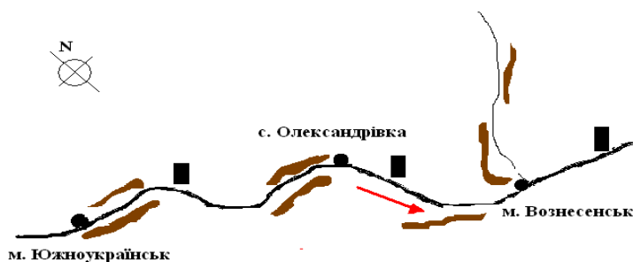
Рис. 1. Карта – схема р. Південний Буг: ■ – місця відбору проб