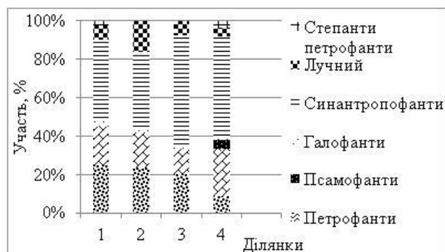
Рис. 3. Еколого-ценотична структура флористичного складу рослинності штучних лісових насаджень Південного Криворіжжя. 1 – Gleditsia triacanthos , 2 – Quercus robur , 3 – Robinia pseudoacacia , 4 – Pinus pallasiana і P. sylvestris .

кількістю видів збільшується перша група, яка має трапляємість до 20 % (28 видів). Типово лісові види належать до другої групи (7 видів), а до третьої відносяться: Stellaria media (L.) Vill., Galium aparine L. та Poa nemoralis L. (який існує переважно в світлових вікнах під наметом). Деяко розширюється четверта група, що включає три види – Geum urbanum L., Anthriscus sylvestris (L.) Hoffm. і Anisantha tectorum (L.) Nevski. До п'ятої групи належать сіянци G. triacanthos та полікарпик Taraxacum officinale Wigg. aggr.