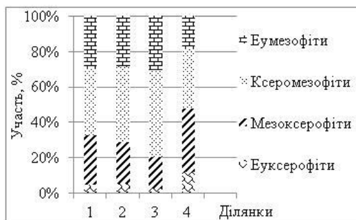
Рис. 2. Екологічний спектр флористичного складу рослинності штучних лісових насаджень Південного Криворіжжя за відношенням до рівня зволоження. 1 – Gleditsia triacanthos , 2 – Quercus robur , 3 – Robinia pseudoacacia , 4 – Pinus pallasiana і P. sylvestris .