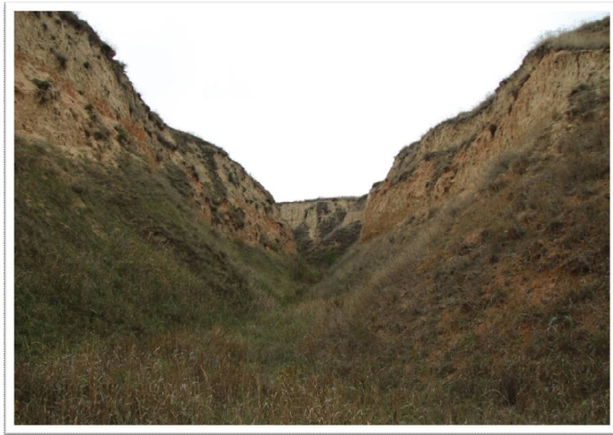
Рис. 1. Лесові відслонення на півдні Херсонщини (Білозерський р-н, окол. с. Широка Балка).

За даними І. Мойсієнка [МОЙСИЄНКО, 2007], на території лесових відслонень виявлено 222 види спонтанно зростаючих судинних рослин, які належать до 155 родів 52 родин 3 класів та 2 відділів. У ярах чітко виділяються три групи флорокомплексів: прилеглі до балки слабкопохилі ділянки та стабілізовані схили; відслонення лесів та глин на крутосхилах; днище балки та підніжжя схилів. На прилеглих до балок та ярів слабо похилих ділянках та стабілізованих схилах в її нижній частині розвинута типова для смуги типчаково-ковилових степів флористична ситуація. Прямовисні стінки майже цілком голі. На крутосхилах виразно домінують лише три види – Agropyron pectinatum , Artemisia lerchiana та Kochia prostrata . Днища балок та підніжжя схилів характеризуються домінуванням ксеромезофітів та зростанням деревних видів рослин.