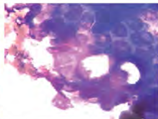
Рис. 5. Цитологическая картина хронического панкреатита