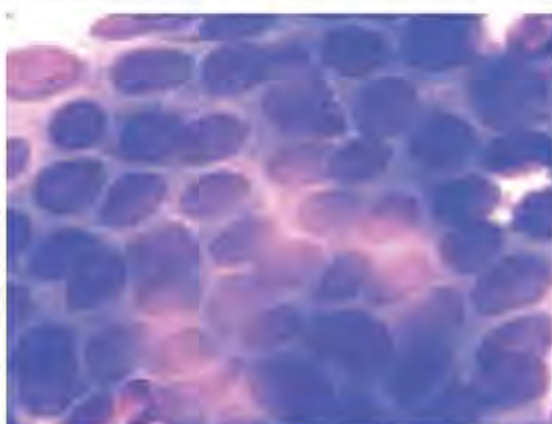
Рис. 4. Цитологическая картина хронического панкреатита