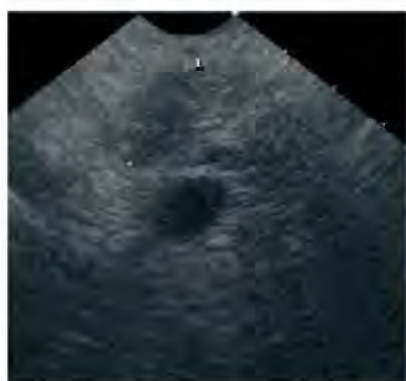
Рис. 3. Эхографическая картина хронического панкреатита (ЭУС)