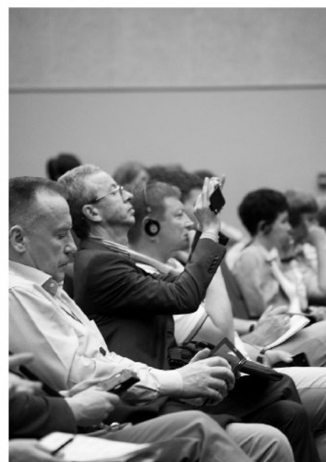
Рис. 8. Врачи «впитывают» знания.