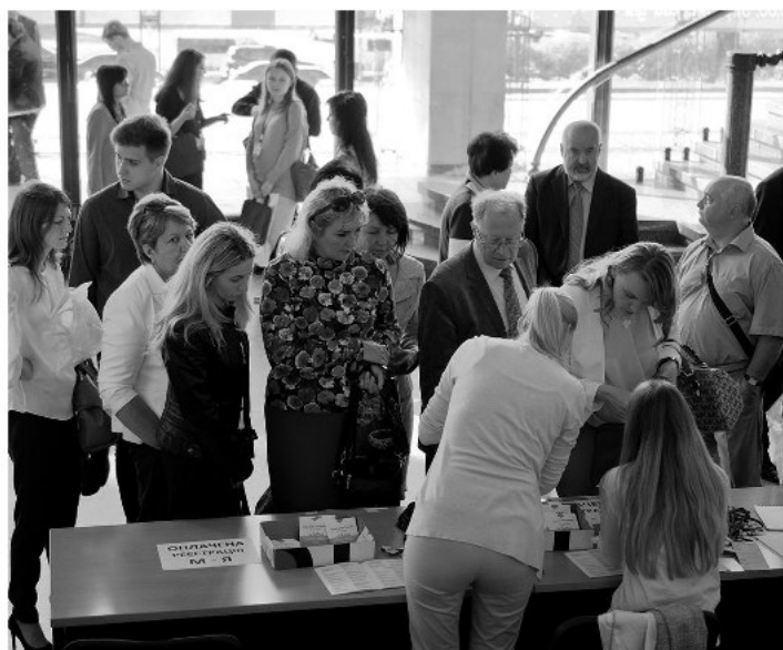
Рис. 1. 26 мая 8:00. Начинается регистрация.