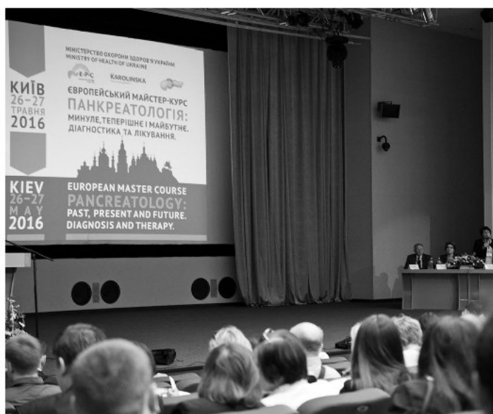
Рис. 2. Открытие мастер-курса.