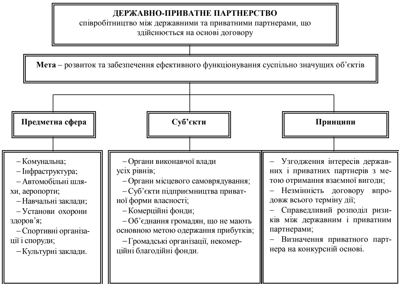
Рис. 1. Концептуальні основи ДПП, визначені Законом України «Про державно-приватне партнерство»

Державно-приватне партнерство розуміється як співробітництво між державними партнерами (державою Україна, Автономною Республікою Крим, територіальними громадами в особі відповідних органів державної влади та органів місцевого самоврядування) та приватними партнерами (юридичними особами, крім державних та комунальних підприємств, або фізичними особами – підприємцями), що здійснюється на основі договору в порядку, встановленому законодавчими актами [7].