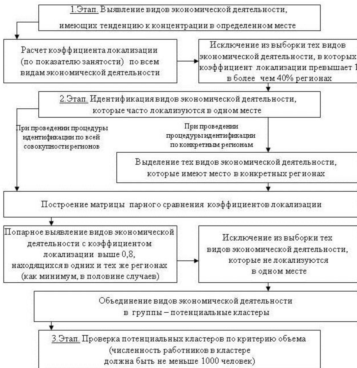
Рис. 1. Алгоритм идентификации потенциальных кластеров в регионе