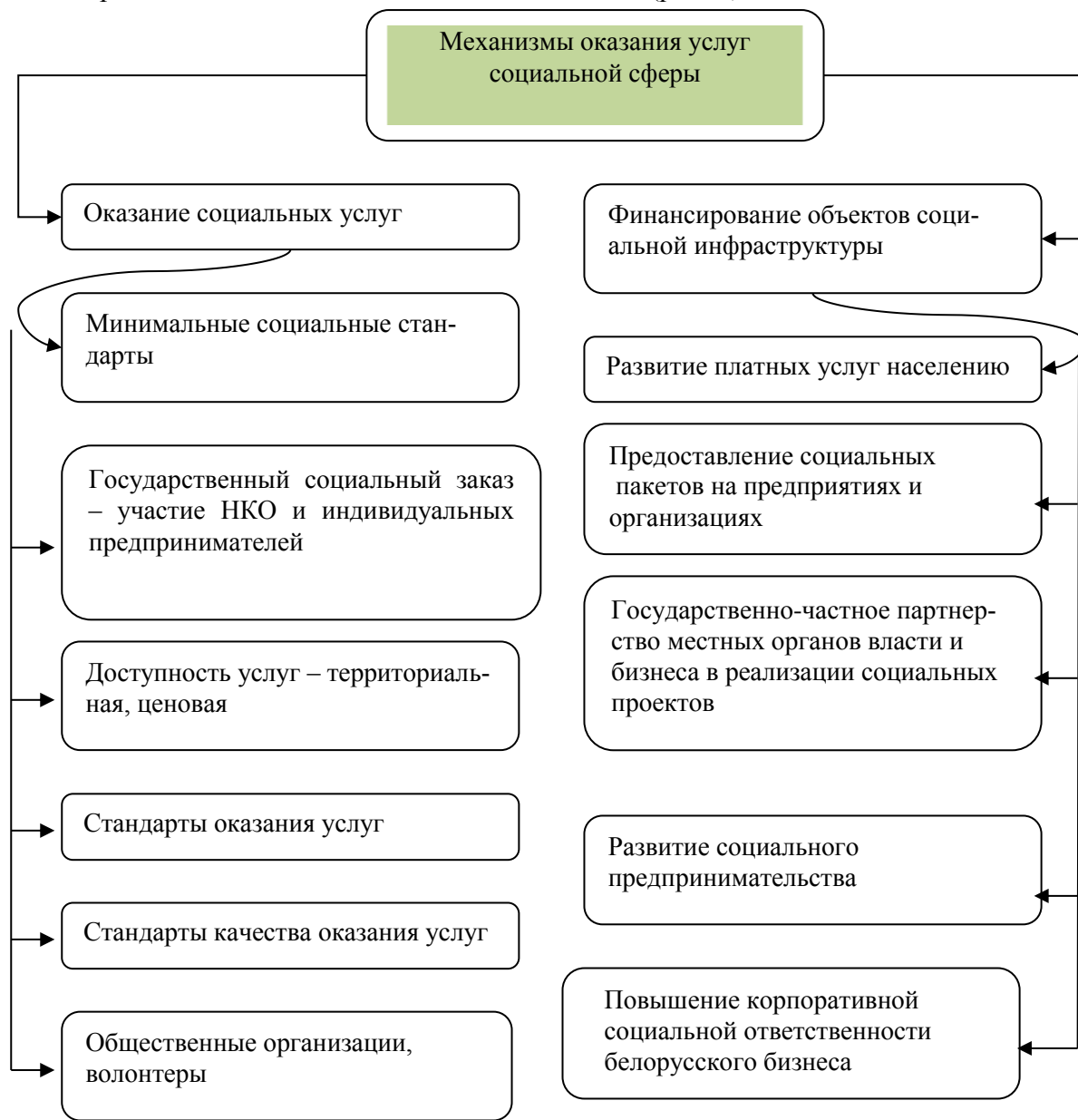
Рис. 2. Механизмы оказания услуг социальной сферы

услуг, так и способствуют развитию объектов социальной инфраструктуры посредством изменения практики их финансирования (рис. 2).