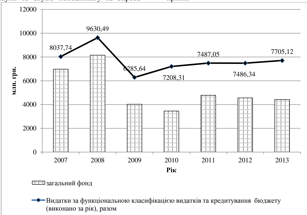
Рис. 1. Державне фінансування сільського господарства (видатки за функціональною класифікацією видатків та кредитування бюджету), 2007 – 2013 рр., млн. грн.

Друга група проблем – неврегульованість фінансових відносин сільськогосподарських підприємств з державою. Ключовим питанням, яке виникає при розробці механізму державної підтримки – визначитися з напрямками її надання – на одиницю виробленої продукції, на гектар ріллі (одну голову поголів'я тварин), на одиницю власного капіталу підприємств або інші напрями.