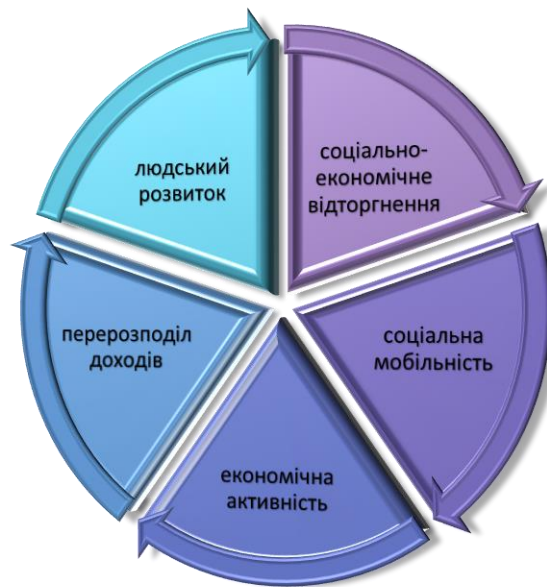
Рис. 1. Ланцюг соціально-економічних трансформацій суспільства

Самоідентифікація індивідів з певним місцем у соціально-економічній ієрархії, зміни в матеріальному становищі різних професійно-статусних груп впродовж 2009-2011 рр. є важливими характеристиками процесів мобільності та соціальної динаміки населення.