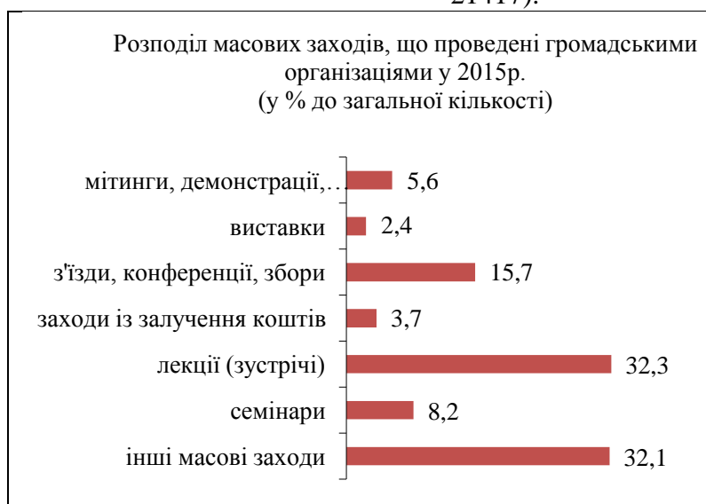
Рис. 1. Розподіл масових заходів, що проведені громадськими організаціями у 2015р. Джерело: [11, с. 5]

Про результати своєї діяльності за 2015р. органам державної статистики [11, с. 5] прозвітувало 22185 керівних органів громадських організацій (у 2014р. – 21417).