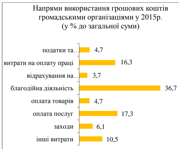
Рис. 3. Напрями використання грошових коштів громадськими організаціями у 2015р. Джерело: [11, с. 6]

Засоби громадських організації можуть бути як тимчасовим інструментом для подолання безробіття в районах високої концентрації внутрішньо переміщених осіб, забезпечує зайнятість населення в складних соціально-економічних умовах, так і в подальшому з-трудничать з державними службами зайнятості для підвищення ефективності вирішення проблеми високого рівня безробіття.