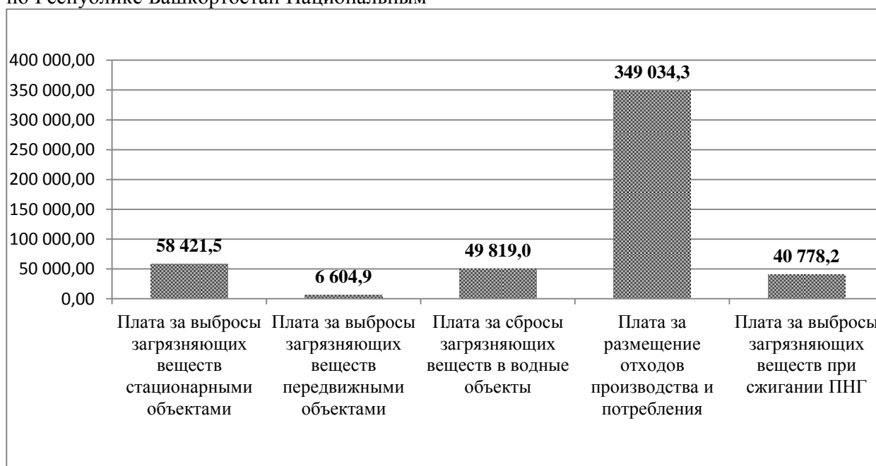
Рис. 2. Поступление платы за негативное воздействие на окружающую среду в бюджет по средам в 2015 году, тыс.рублей

Общее поступление платы за НВОС в бюджет по средам в 2015 году рассмотрено в следующем рис. 2.