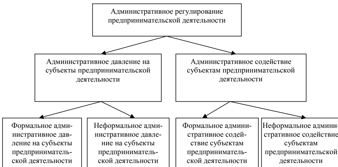
Рис. 1. Схема административного регулирования предпринимательства

Таким образом, необходимо говорить не только об административном давлении на предпринимательство, но и об его потенциале, то есть о возможной диапозоне негативного воздействия на субъекты бизнеса со стороны властных структур.