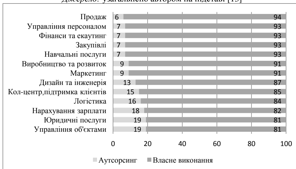
Рис. 3. Аутсорсинг бізнес послуг європейських підприємств, %