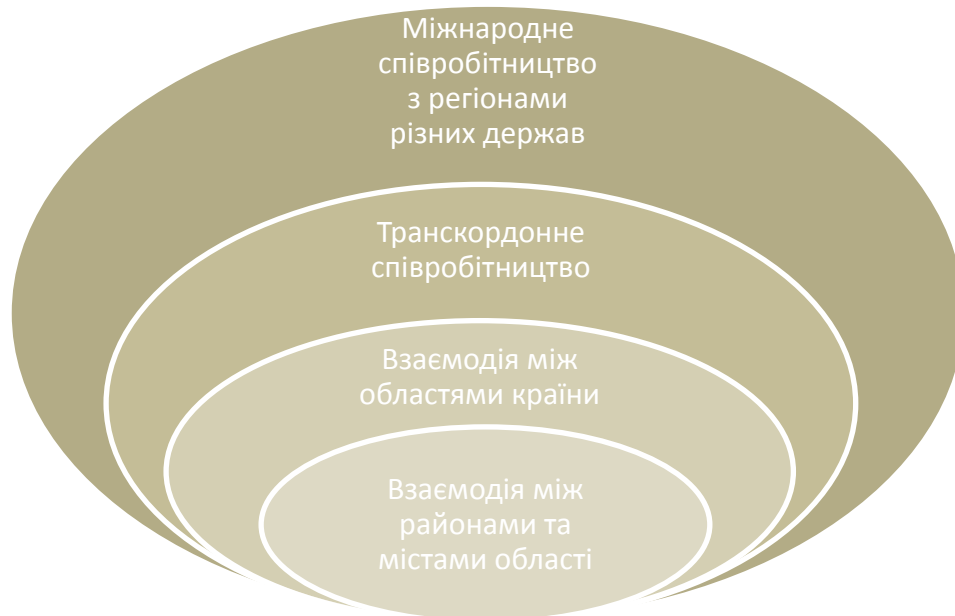
Рис. 1. Рівні міжрегіонального співробітництва в Україні.

Виклад основного матеріалу дослідження. Міжрегіональне співробітництво – це поняття дуже багатогранне. У загальному розумінні міжрегіональне співробітництво передбачає взаємодію органів влади, суб'єктів господарювання, наукових та громадських інституцій різних територіальних формувань (областей, міст, районів тощо) однієї або різних (декількох) держав у сфері державного управління, економіки, соціального забезпечення, науки, освіти, культури та екології з метою забезпечення стабільного соціально-економічного розвитку як окремих територій-учасників співпраці так і країни в цілому. Рівні міжрегіонального співробітництва можна представити схематично (рис. 1).