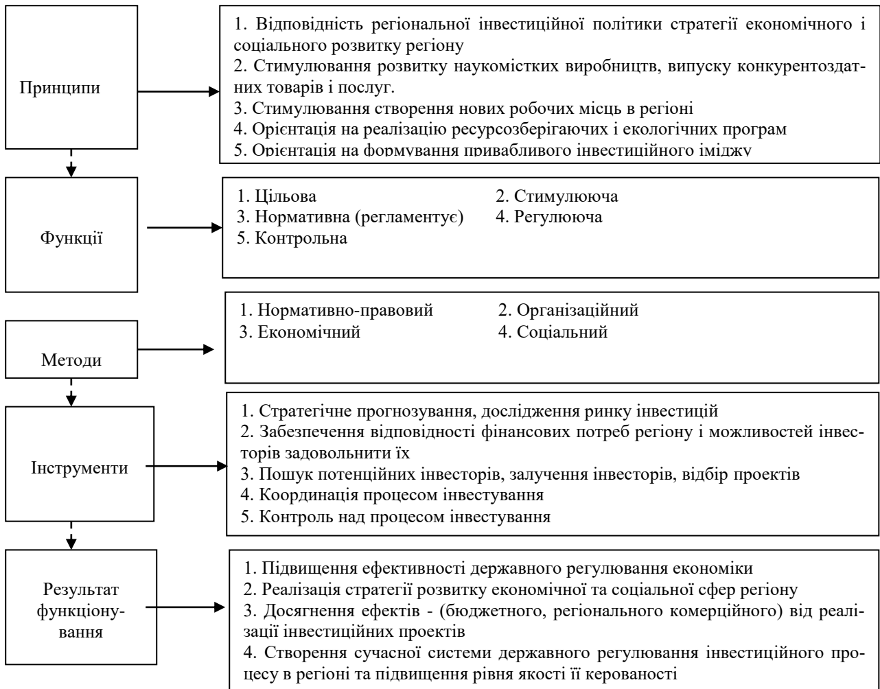
Рис. 3. Аналітичний інструментарій системи державного регулювання інвестиційного процесу в регіоні