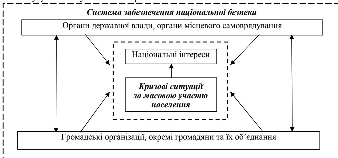
Рис. 4. Місце протидії кризовим ситуаціям за масовою участю населення у системі забезпечення національної безпеки

Таким чином, з урахуванням наведеного вище можливо подати структурну схему системи забезпечення національної безпеки і місця у ній протидії кризовим ситуаціям за масовою участю населення (рис. 4).