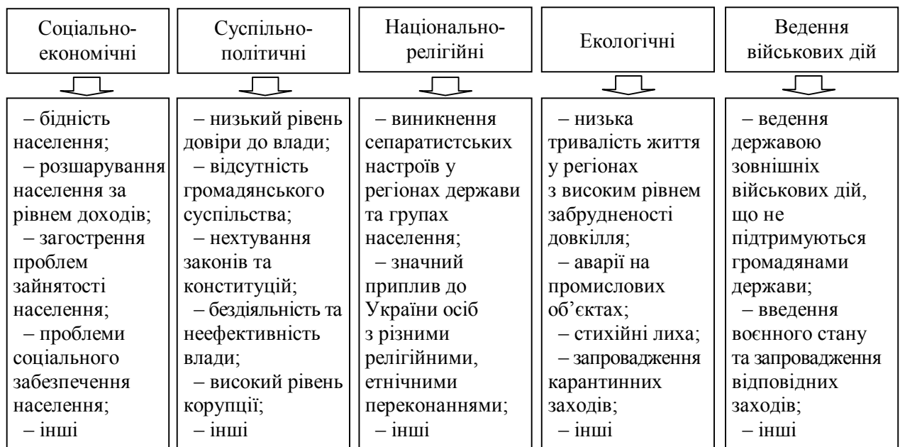
Рис. 1. Основний перелік причин виникнення кризових ситуацій за масовою участю населення

Останні кризові події у країнах Західної Європи та країнах Північної Африки свідчать, що найбільш гострими, масовими і соціально небезпечними кризовими ситуаціями є такі, що породжені низьким рівнем життя населення та невирішеністю соціальних проблем. Саме вони є підґрунтям конфліктних ситуацій, що виникають між населенням держави та владою. Отже, найбільш доцільним і актуальним є дослідження кризових явищ саме