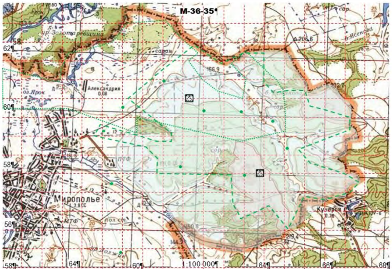
Рис. 3. Варіант використання засобів радіозв'язку охорони державного кордону на ділянці відповідальності відділу прикордонної служби