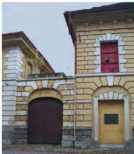
Рис. 6. Казарми Bodenbach (1792 р.)

парку. Ідентичними казармам Bodenbach були казарми Ганновері на протилежному боці міста. Крім того, на цьому ж рисунку зліва можна побачити стіни бастиону, який виглядає з гарнізону на сторону півночі. Прямо навпроти, на південній стороні гарнізону, є ще один ідентичний бастион. Відповідно будівлі казарм розташовувалися між подвійними стінками кожного бастиону. Усередині стін, на південній стороні, розміщувалася перукарня.