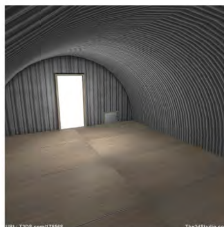
Рис. 16. Службове приміщення для рядового складу в польових умовах: а – план-схема приміщення; б – фасад приміщення; в – вхід до приміщення; г – внутрішній простір приміщення