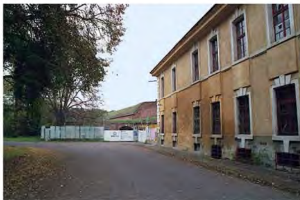
Рис. 5. Bodenbach казарми

На фотографіях (рис. 4 і 5), що зроблені у 2000 р., бачимо казарми, які німці називали казармами Bodenbach (аграрний струмок); на задньому плані північної сторони – бастион. Казарми слугували металевим бар'єром перед бастионом, приховуючи його з чільного боку, і в той же час це була закрита територія для туристів із "шлюзом" усередині стіни бастиону. Будівля мала примітивний вигляд з грубими кам'яними підлогами. Складалася з двох частин, розділених вузьким внутрішнім двором.