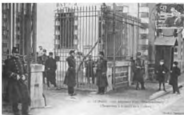
Рис. 2. Казарми 117-го піхотного полку в Інле-Ман, Франція (1900 р.)