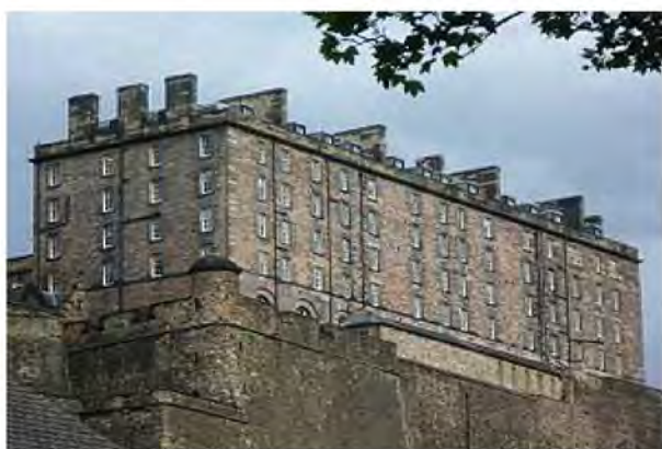
Рис. 3. Казарми за царювання Георга III, Единбурзький замок (кінець XVIII ст.)

Перші казарми, такі, як римської преторіанської гвардії, були побудовані для підтримання елітних сил. Є деякі залишки казарм римської армії у прикордонних фортах, зокрема таких, як Vercovicium та Vindolanda . Завдяки порівнянню залишених історичних та сучасних військових