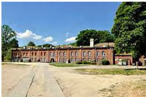
Рис. 1. Казарми у Гданську, Польща

Можуть будуватися у вигляді окремого корпусу, блоку або комплексу (рис. 1 і 2), а також у вигляді архітектурної пам'ятки (казарми Коллінз у Дубліні, Единбурзький замок у Единбурзі – рис. 3) [2–5].