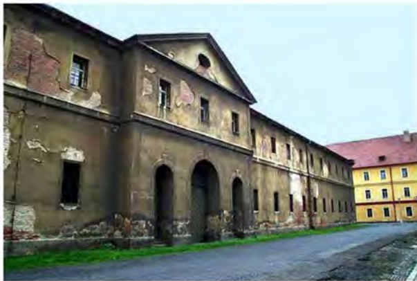
Рис. 8. Ганновер казарми (ліворуч) та казарма Магдебурга (праворуч)

Бачимо вхід до казарми Дрезден для жінок, який виходить на Hauptstrasse (Гауптштрассе). Ганновер казарми подано на рис. 8.