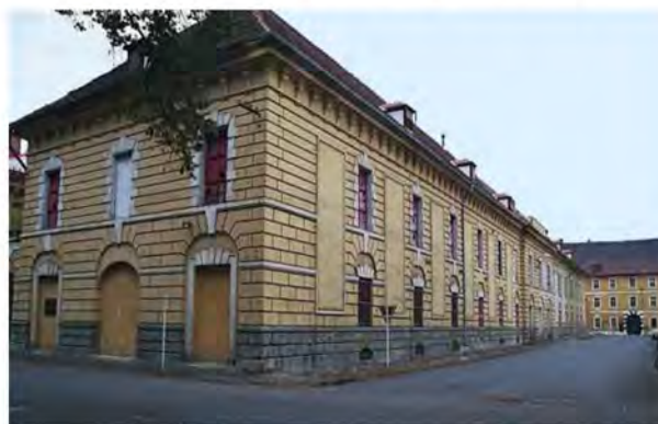
Рис. 7. Дрезден казарми для жінок у фоновому режимі (праворуч)

Будівлю казарм Bodenbach, якщо дивитися на Гассе (північна сторона), зображено на рис. 7.