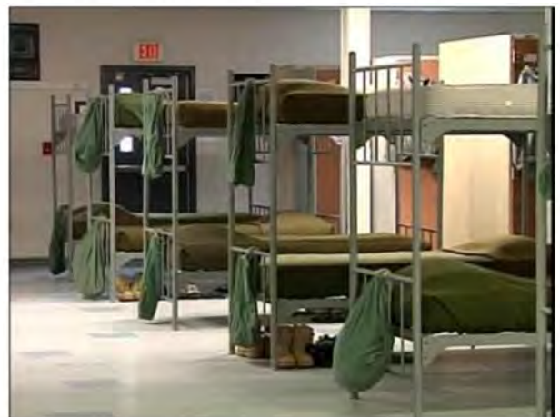
Рис. 11. Казарми у США

Аналіз міжнародного досвіду засвідчив, що військовослужбовці збройних сил США під час базової підготовки, а іноді й подальшого навчання живуть у казармах (рис. 11).