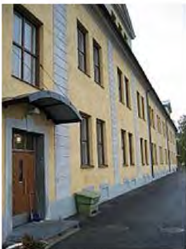
Рис. 9. Казарми для призовників 10-го піхотного полку у Бодені, Швеція

Вивчивши міжнародний досвід проектування й оформлення службових приміщень військової частини, можна зауважити, що у багатьох країнах військовослужбовці сержантського і рядового складу розміщуються в казармах під час служби або навчання (рис. 9 і 10).