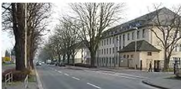
Рис. 10. Німецькі казарми для військ Bundespolizei (федеральної поліції) у Франкфурті, Німеччина

Молоде поповнення, а іноді й молодші сержанти не отримують належних місць, і тому вони можуть бути розміщені у бухтах, у той час як старші сержанти та офіцери проживають як у загальних, так і окремих кімнатах. Термін “гарнізон міста” стосується будь-якого міста, у якому розташовані військові казарми, тобто у місті або поблизу нього розміщені війська.