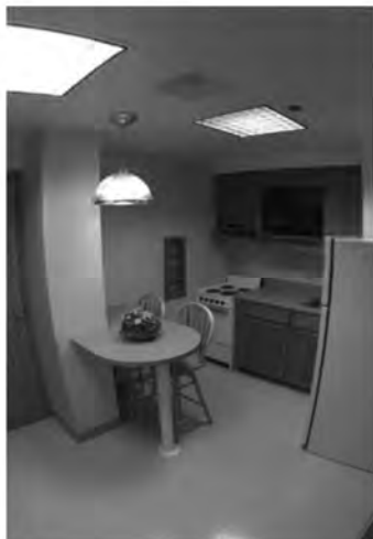
Рис. 12. Кухня за американським проектом “1+1”

Уже на сьогодні США витрачено більше 1 млрд доларів. За американськими підрахунками гуртожитки нового стандарту будуть дорожчими, однак гроші, виділені міністерству оборони, підуть на підтримання бойової готовності та продуктивності сили.