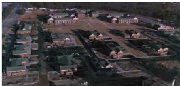
Рис. 13. Казармені комплекси у США

У доповнення до зазначеного вище у США діє ще один проект – “4+1” (рис. 13).