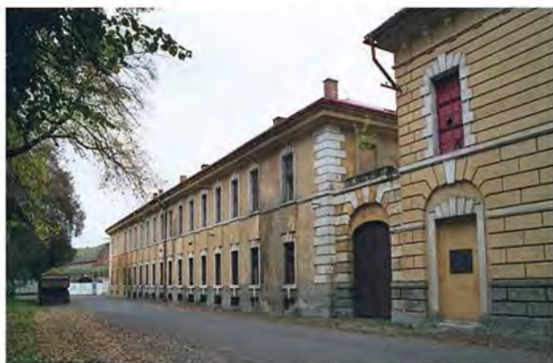
Рис. 4. Казарми у Гетто Терезин

Під час Другої світової війни, коли євреї Великого німецького рейху були відправлені до колишнього військового гарнізону в Терезині, вони розміщувалися в одинадцяти будівлях, колишніх казармах, які використовувалися австрійськими солдатами у XVIII ст.