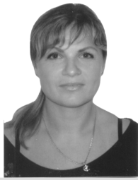
А. В. Харитоновна