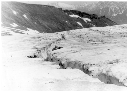
Рис. 3. Розподіл напрямків ведення вогню

За експертними оцінками основу опорного пункту мали скласти дві позиції відділень, прив'язані до природних фірнових тріщин, які необхідно було обладнати чарунками для ведення вогню стоячи і захисту від вогню противника (насамперед, з флангів). Передбачалося обладнати частину чарунок з напрямом на фронт, частину – у тил (рис. 3).