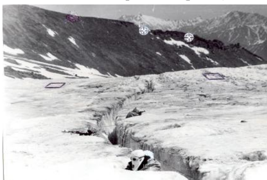
Рис. 5. Ділянки зосередження вогню у районі розвинутих фірнових (льодовикових) тріщин та об'єкти-цілі для снайперів

Тепер стосовно визначення раціонального варіанта організації та створення системи вогню. Слід нагадати, що складники побудови оборони, а саме бойовий порядок, опорний пункт (зі своїми особливостями його інженерного обладнання) та система вогню міцно пов'язані загальним замислом на побудову оборони в цілому (у нашому випадку – кругової оборони). Як відомо, система вогню з початку організується, а потім безпосередньо створюється. У цьому разі система вогню мала забезпечити можливість вогневого ураження противника в азимуті від 0° до 360° на глибину дійсного вогню. Зона суцільного вогню являла собою замкнуту смугу у вигляді овалу з поздовжньою віссю за напрямом фірнових тріщин. Особливо були визначені дві ділянки зосередженого вогню. Вони були пов'язані з особливостями місцевості, а саме її елементами, що перешкоджають прискореному пересуванню противника й обумовлюють його скупчення. Ці ділянки припадали на район розвинутих фірнових тріщин зі сніговими пробками (рис. 5).