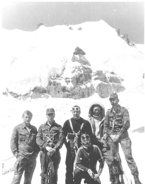
Рис. 2. Частина особового складу групи після підйому на гірське плато

покриві (з інтервалами та дистанціями до 50 м) та спроба замаскуватися. Системність у прийнятті рішення у цьому тактичному епізоді не простежувалася. Стан особового складу після підйому на плато (практично без перерв на відпочинок) певною мірою за зовнішнім виглядом відображено на рис. 2.