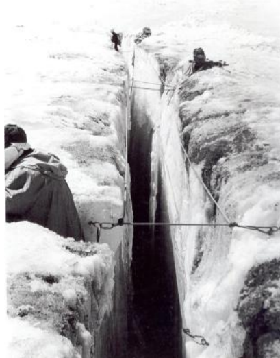
Рис. 4. Двох'ярусні перила

Вивчення і визначення порядку інженерного обладнання опорного пункту зайняло основний час досліджень. На підставі замислу на організацію системи вогню були позначені ділянки фірнових тріщин та місця обладнання вогневих чарунок з урахуванням можливостей наявного альпіністського колективного спорядження (в основному, кількості та довжини мотузкових бухт). Після дослідження і випробування різних варіантів обладнання тріщин мотузковими перилами вибір був зупинений на навішуванні від чарунки до чарунки двох ярусів перил уздовж обох стінок тріщин з використанням льодових гаків та звичайних карабінів (рис. 4).