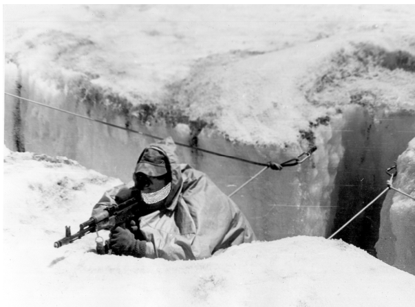
Рис. 7. Стрелець у сріблястій плащ-накидці

Дослідження способів тактичного маскуванню опорного пункту та індивідуального маскуванню військовослужбовців було заключним етапом. Головним завданням маскуванню було зниження контрастів основних елементів опорного пункту (обладнаних в інженерному відношенні тріщин та ходів сполучень) до прийнятого рівня. Критерієм допустимого контрасту у видимому діапазоні було K < 0,3 . Елементи з контрастом нижче наведеного значення, як правило, виявити (виділити на тлі місцевості) неозброєним оком (навіть фахівцю військової розвідки) достатньо складно. Маскуванню проводилося підручними засобами – в основному, чорнінням фірну скелястою жорсткою та ручними димовими гранатами чорного диму, а також сріблястими полотнищами для накриття чарунок. Для індивідуального маскуванню стрільців успішно використовувалися сріблясті плащ-накидки (рис. 7).