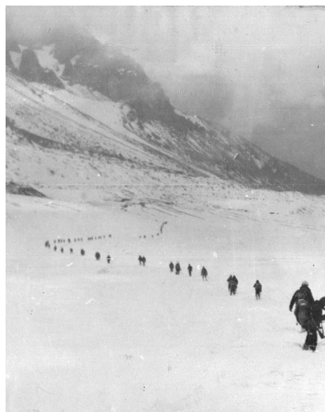
Рис. 1. Підйом на гірське плато

Серед бойових можливостей під час здійснення підйому на плато особлива увага приділялася дослідженню спеціальних можливостей. Як пріоритетний складник спеціальних можливостей досліджувалася здатність прийняття рішень за увідними на основі системного підходу на тлі суттєвих психофізичних навантажень особового складу. Слід відмітити, що на прискорений підйом на плато (~4200 м) з вихідного пункту (~1800 м) за тактичним завданням відводилося 5 год, що передбачало енерговитрати тільки на пересування з корисним вантажем у потенційному полі тяжіння Землі до 3,0 МДж. З урахуванням витрат на підтримання шляхової стійкості у поперечній площині, тепловтрат з відкритих частин (в основному з обличчя) та втрат тепла з повітрям, що видихається, сумарні енерговитрати наближалися до 4 МДж. Прискорений підйом з корисним вантажем (включаючи зброю, він складав до 25 кг) був здійснений за 4 год 40 хв (рис. 1).