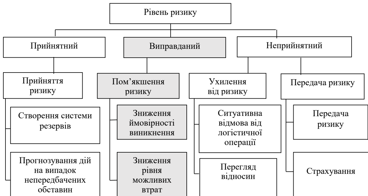
Рис. 1. Способи дій за різних рівнів ризиків логістичного забезпечення Національної гвардії України

Один із найпростіших (трирівневий) варіантів ранжування ризиків за рівнями та способами дій подано на рис. 1.