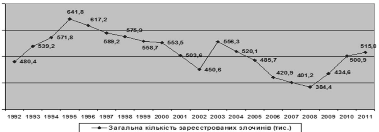
Рівень зареєстрованої злочинності в Україні (1992–2011 рр.)

Як бачимо, рівень загальної кількості зареєстрованих у країні злочинів починаючи з 1995 р. поступово , але стабільно зменшується 5 . Виняток становить стрибок цього показника у 2003 р., коли абсолютна кількість зареєстрованих злочинів сягнула 556351 злочину, що на 15,8 % більше, ніж у 1992 р. та на 23 % більше щодо попереднього 2002 року. Починаючи з 2004 р. цей показник продовжує більш інтенсивно знижуватися (середньорічний темп зниження щодо кожного попереднього року становить 8 %), сягнувши у 2008 р. в абсолютних цифрах 384424 злочинів, що у 5 разів (на 20 %) менше, ніж у 1992 році. Однак з 2009 р. загальна кількість зареєстрованих в країні злочинів знов починає поступово зростати, сягнувши у 2010 р. відмітки 500902 злочини, що на 4,2 % більше, ніж у 1992 р. та на 15,2 % більше щодо попереднього 2009 року. У 2011 р. цей показник становив 515833 злочини, що на 3 % більше щодо попереднього 2010 р. та на 7,3 % більше, ніж у 1992 році.