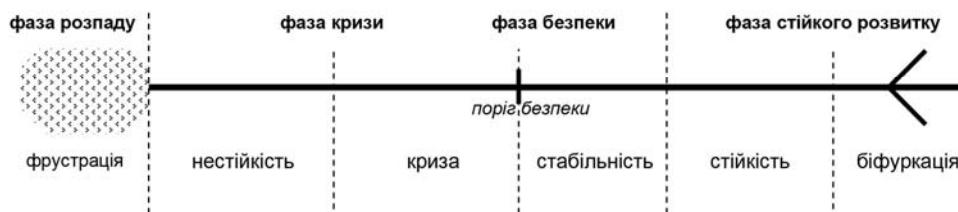
Рис.4. Коридор розвитку економіки від нестійкого до стійкого стану

Признаємо, що фази (див., наведено автором на рис. 4) представляють собою визначений момент у ході розвитку економіки і складаються з певних стадій. У відповідності з цим, необхідно визнати, що розвиток економічної системи як перехід на новий якісний рівень невіддільний від протилежних йому процесів руйнування і занепаду структур. Залежно від того, який процес йде швидше, відбувається реальний розвиток або розпад системи. Звідси фаза розпаду супроводжується фрустрацією, тобто руйнуванням цілісності системи без можливостей зворотного розвитку або відновлення.