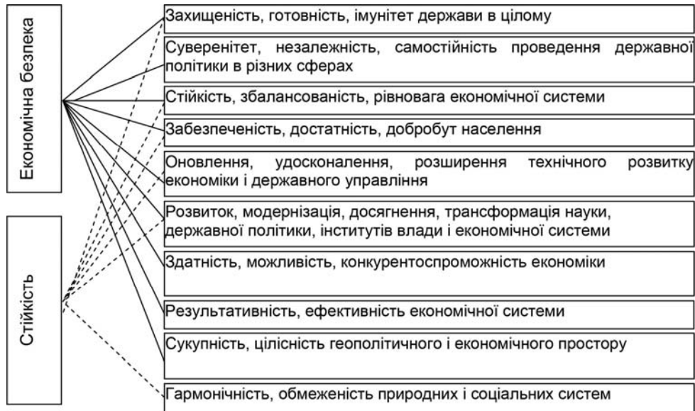
Рис. 1. Перетинання ознак економічної безпеки і стійкості *

ючи вище сказане, зауважимо, що прямий та зворотній взаємозв'язок між категоріями „економічна безпека” і „стійкість” дозволяє розширити сферу вивчення макроекономічних процесів. Тому, залежно від зміни стану стійкості економіки можна судити про забезпеченість її безпеки. Звідси керуюча система держави має можливість виробляти єдині узгоджені заходи, спрямовані одночасно на стійкий розвиток національної економіки та зміцнення економічної безпеки.