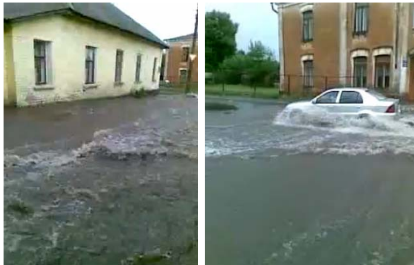
Рис. 2. Зливові води по вул. Десняка у м. Чернігові

Зазначимо також, що при великих зливах за рахунок відсутності належних інженерних систем відводу зливних вод вірогідність перезволоження ґрунтів в небезпечних районах м. Чернігова може різко зрости (рис. 2).