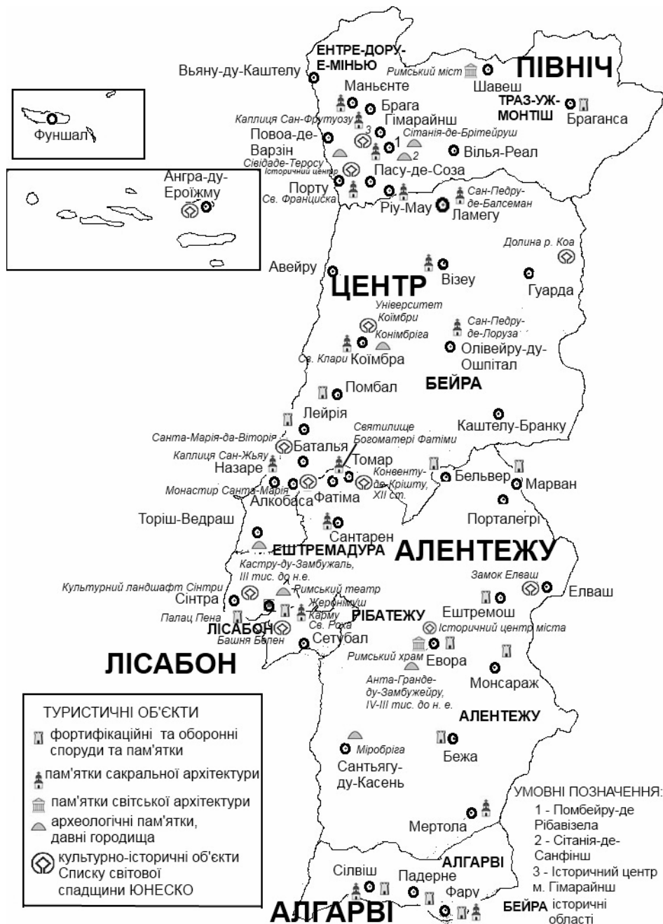
Рис. 3. Культурно-історичні ресурси Португалії (на основі [4, 5, 6, 11, 15, 17])

Поблизу м. Коїмбра розміщене поселення римського періоду Конімбріга. Тут розміщений національний музей, до якого входять міцні стіни, акведук, бані, амфітеатр, будинки для середнього класу суспільства ( інсула ) та вищого класу ( домус ), з унікальною мозаїкою [5,6].