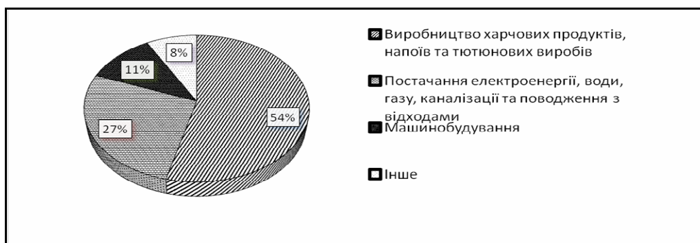
Рис. 1. Структура реалізації продукції промисловими підприємствами Івано-Франківська [1]

функціонував приблизно до початку 2000-х рр., коли він перейшов у власність компанії «Гаразд», яка взяла на себе відповідальність по відновленню даної пам'ятки. Проте ця організація не реставрувала варний цех, як було домовлено, а знищила дану будівлю і на її місці побудувала нову, в приміщенні якої зараз знаходиться заклад швидкого харчування. Інший солодовий цех знаходиться в аварійному стані і наразі потрібно докласти значних зусиль для його реставрації.